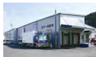
■ 四万十営業所 兼 豚肉解体工場