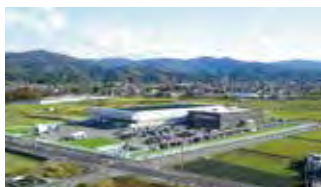
■ 本社 総務部・管理部・品質管理室・営業部(第一・第二・第三・第四・第六営業)