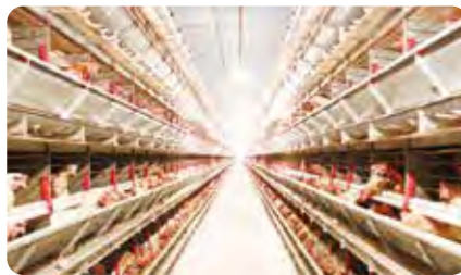
ウインドレス鶏舎内