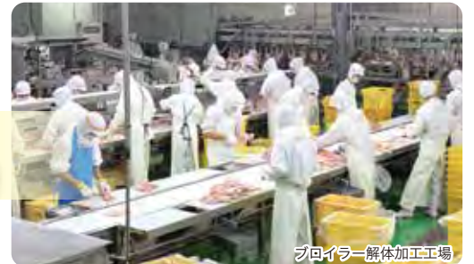
ブロイラー解体加工工場