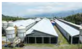
■ 丹原ファーム (養豚)