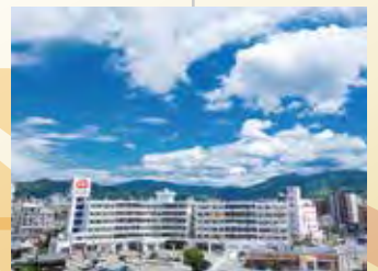
ビージョイマンション