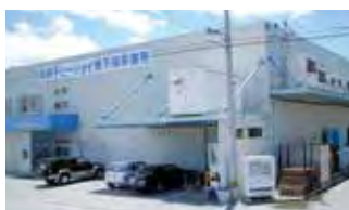
■ 本社（総務部・管理部・水産事業部）

畜産・水産物を原料とし、半製品（唐揚・とんかつ等）・串製品などを自社加工しています。国産志向が高まる中、国産原料の焼鳥などが好評です。冷凍食品、水産加工品も販売しています。