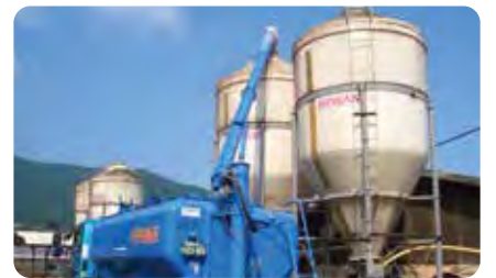
飼料運搬車にてタンクへ給餌