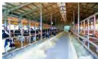
■ 西予営業所 (牛肥育農場)