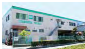
■ プロイラー事業部