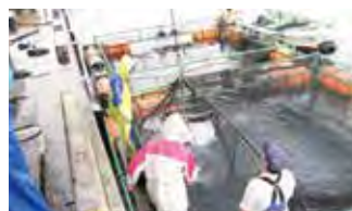
■ 鹿児島出張所（取引先での水揚げ様子）