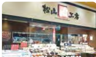
直売店 松山肉工房(アミナル松前内)