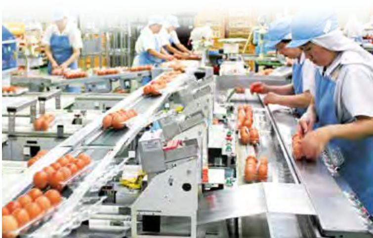
パッキング工場ライン