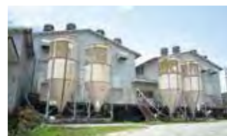
■ 宇和ファーム (採卵養鶏)