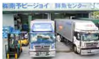
■ 鮮魚センター（坂下津事業所）