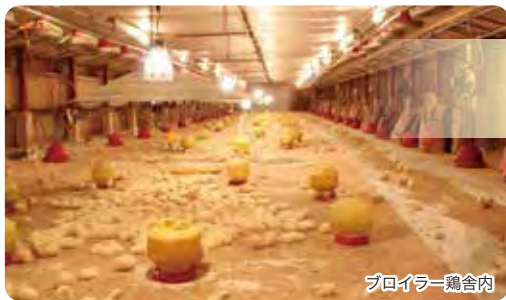
ブロイラー鶏舎内