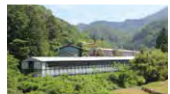
■ 広田プロイラー（養鶏）