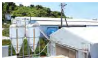
■ 菊間ファーム (採卵養鶏)