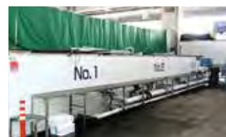
■ 東京事業所（足立市場内生簀）