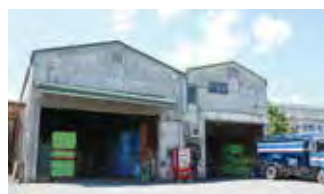
■ 飼料配送センター